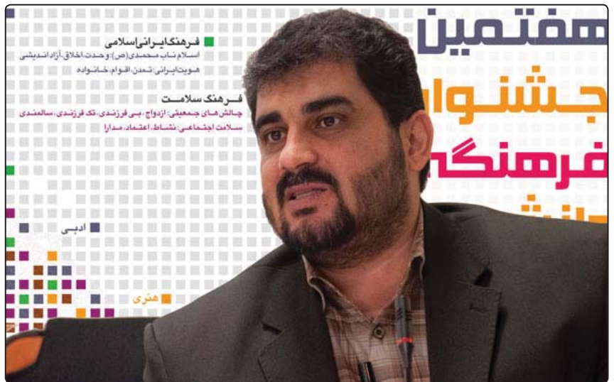
مدیرکل فرهنگی وزارت بهداشت: